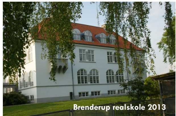
Brenderup realskole 2013

Brenderup er en skole-, kultur- og idrætsby.