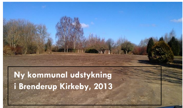
Ny kommunal udstykning i Brenderup Kirkeby, 2013

Det er muligt flere steder i byen at købe velplacerede både private og offentlige byggegrunde, tæt på skole og idrætsfaciliteter.