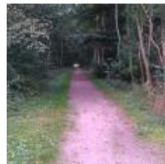
Jernbanestrækning mod Odense, som den ser ud i 2013

Slut med humle var ikke slut med specialproduktioner i Brenderup sogn! I sidste halvdel af 1800-tallet blev der dyrket tobak på nordkysten mellem Middelfart og Båring, og det bredte sig videre til Brenderup, og ikke mindst med 1. verdenskrigs stigende priser på tobak blev det en ny god forretning for egnen. I 1929 søgte og analyserede ingeniøren Eckardt Sidenius sig frem til det ideelle sted for tobaksdyrkning i Danmark – Brenderup havde de ideelle klima- og jordbundsforhold. Grundlaget for en ny specialproduktion var videnskabeligt bevist! Salget af dansk (dvs. fynsk) tobak boomede igen under 2. verdenskrig, men da der igen blev adgang til udenlandsk tobak var det slut. Fra slutningen af 1800-tallet var andre specialproduktioner på vej frem i området – frugtavl og senere bær- og grøntsags avl. Og det er her endnu!