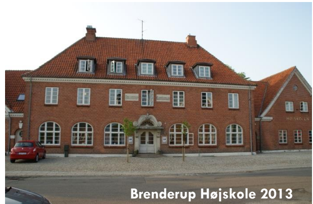
Brenderup Højskole 2013

I 1911 åbnede Brenderup Realskolen, en borgerlig skole med ambition om at hæve undervisningen op på bymæssigt niveau. Der har i en periode været både teknisk skole og en mindre pigefterskole.